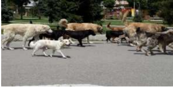
Figure 4 – Qentë në Lezhë pa matrikull