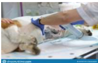
Figure 6 – Trajtimi post operator

(Foto ilustruese mbi trajtimin post operator)