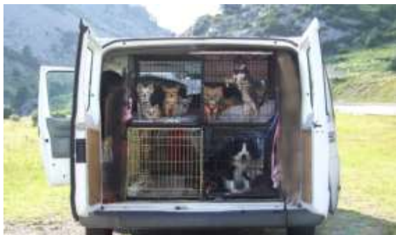
Figure 2 – Si të transportohen kafshët të kapura (Matthews, 2019)