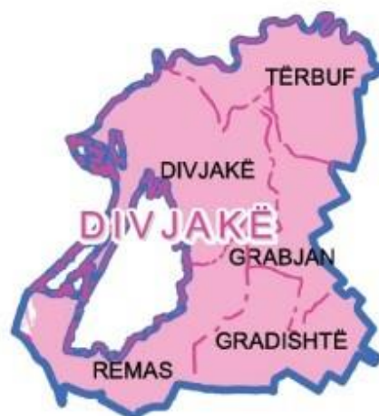
Fig.3 Bashkia Divjakë

Divjaka ka perspektivë të mirë për zhvillimin e turizmit detar si dhe ekoturizmit. Gjatë viteve të fundit këtu është shfaqur turizmi i vrojtimit të zogjve për shkak të pranisë së një kolonie të vogël pelikanësh në zhdukje në lagunën e Karavastasë.