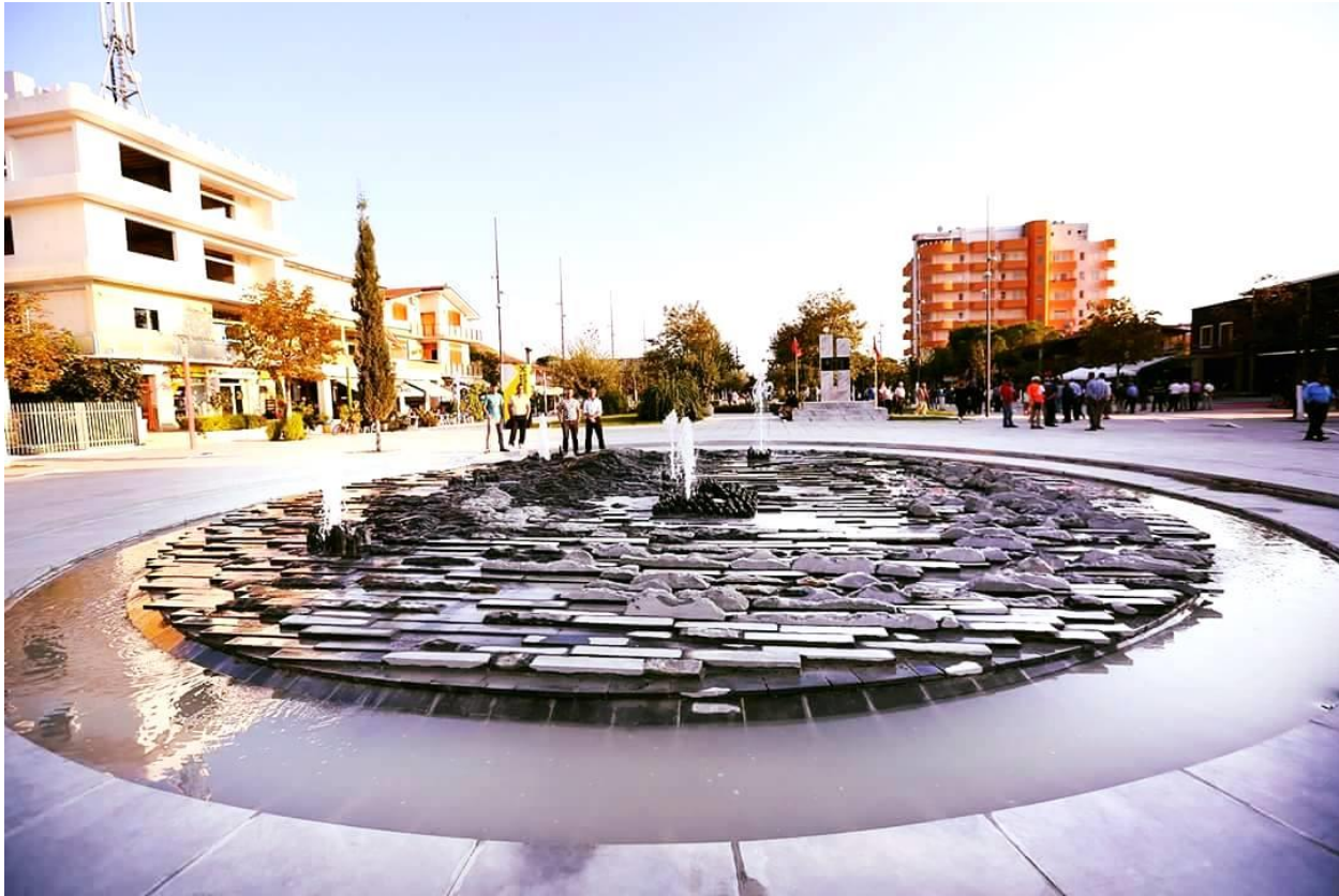
Fig.2 Qyteti i Divjakës

Me parkun kombëtar Divjakë-Karavasta dhe fushat rurale pjellore, bashkia e re e Divjakës ofron një perspektivë të mirë zhvillimi për bujqësinë dhe ekoturizmin.