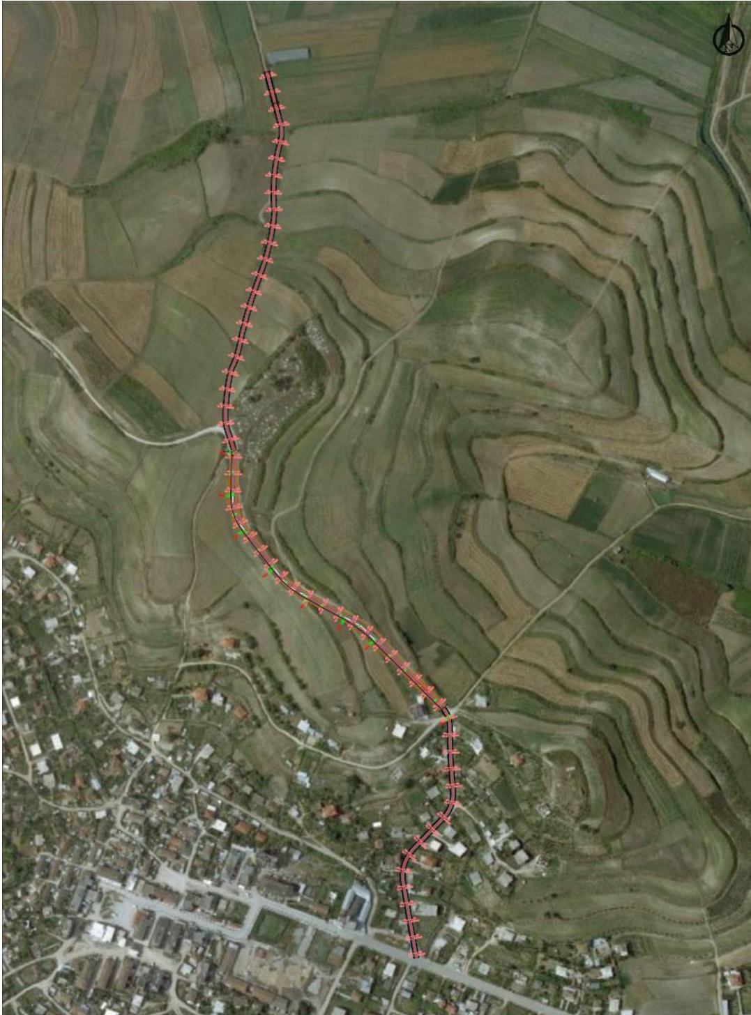
Fig.1 Horografia e zones

OBJEKTI: RIKONSTRUKSION DHE ZGJERIM RRUGA GRABJAN-DUSHK CAN, BASHKIA DIVJAKE