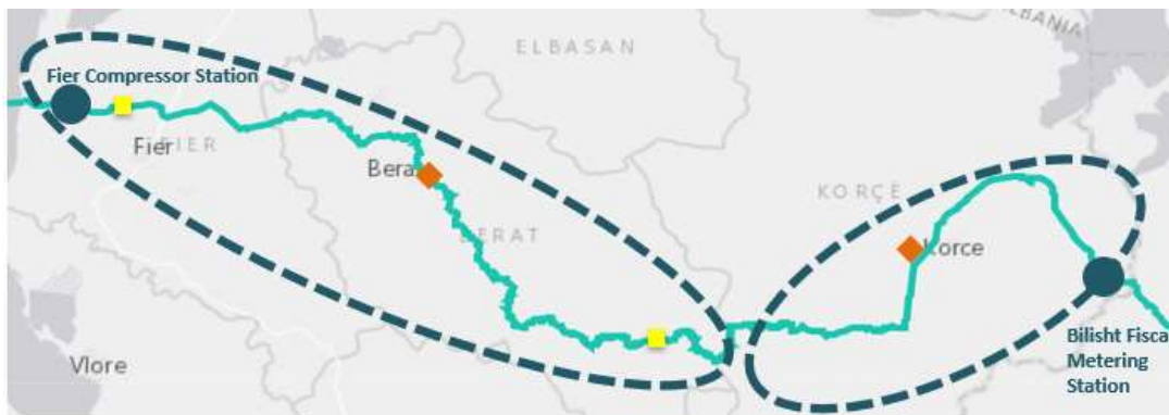
Figura 2: Ndarja e tubacionit në dy zona kryesore