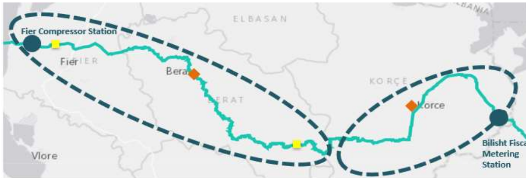
Figura 2: Ndarja e tubacionit në dy zona kryesore

Tubacioni që kalon territorin është rreth 215 km, i cili fillon nga kufijtë jug-lindorë me Greqinë dhe përfundon në bregdetin e detit Adriatik. Tubacioni përbëhet nga dy zona kryesore, zona e Korçës dhe zona e Beratit, Çorovodës dhe Fierit.