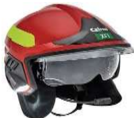
Për drejtuesin/komandantin e zjarrfikësit