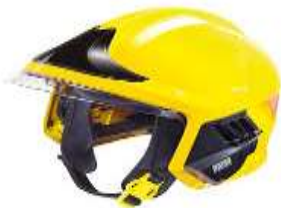
Për zjarrfikësin operues