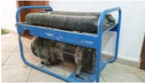
Gjenerator rryme : tip “BLIZZER” me benzene BL 5000.