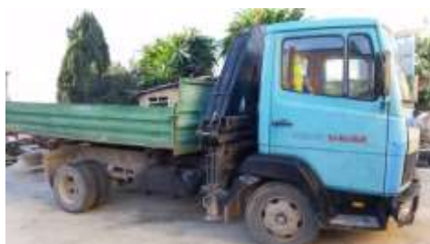
Daimler Benz 814 kamion me targa AA695FR viti 1986 shasia WDB67401215266219