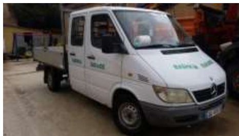
ATP Daimler Chrysler 311CDI Sprinter me targa AA979TX viti 2001 shasia WDB9036221R315902