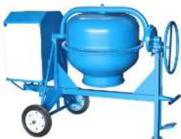
Betoniere ndertimi, 180 Lt, motorr 6.5 HP

Mjetet qe zoteron Ndermarrja jone dhe qe do te mirembahen sipas kesaj nee vend jane: