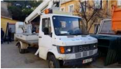
APV Mercedes benz tip kosh 408D me targa AB367HA viti 1991 shasia WD86113181P152749