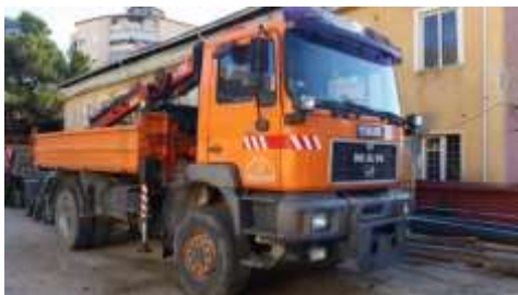
MAN kamion me vinç me targa AA792UG viti 2000 shasia WMAT34ZZZ1M308039