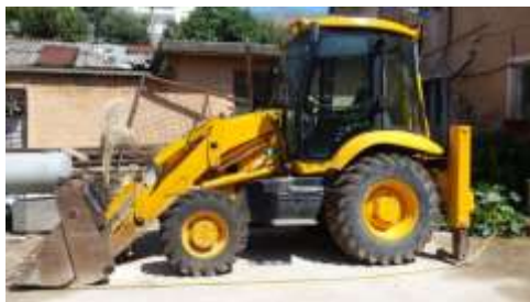
JCB 3cx Skrep me targa AGMT66 viti 2003 shasia SLP3CXTS3E09376681

Ndermarrja jone, zoteron keto automjete ,qe do te mirembahen dhe sherbehen sipas kesaj kontrate: