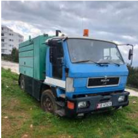
APV MAN Autobot E49 me targa SR6702B viti 1996 shasia WMAE490063L012351