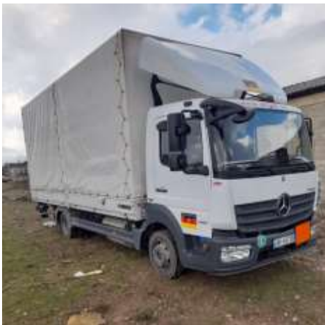
Automjet per transport mallrash me mbulese Mercedes Benz Atego me targa AB047DB viti 2017 shasia WDB96702110121010

Mjetet qe zoteron Ndermarrja jone dhe qe do te mirembahen sipas kesaj nee vend jane: