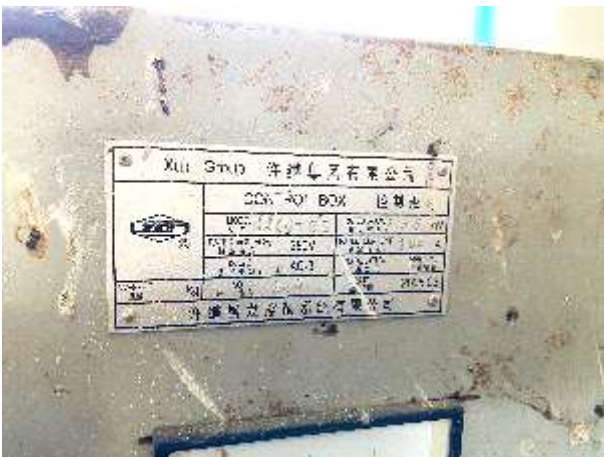
Motorri i pompes i riparuar ne 2005