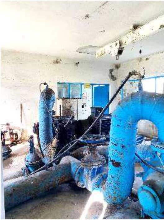
Pompa e cila dergon ujin ne depot e njesive administrative