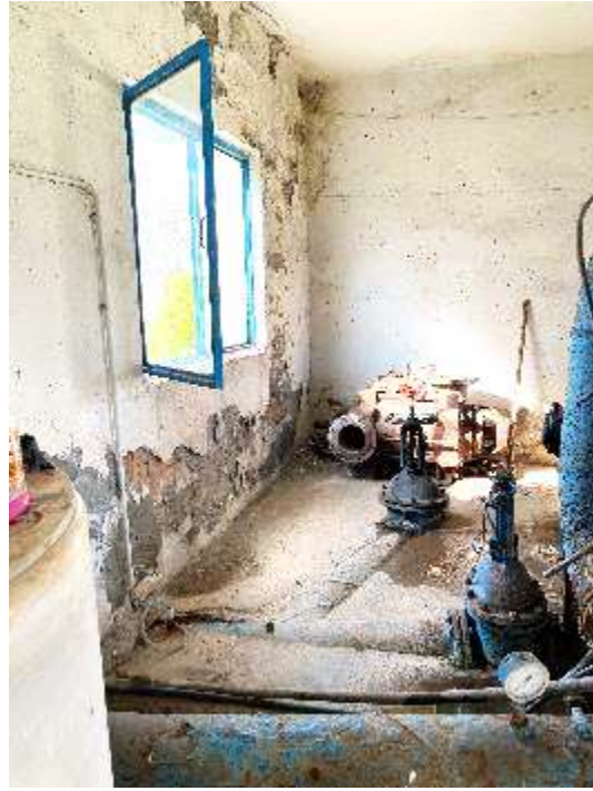
Gjendja e amortizuar e sistemit te komandimit te pompave