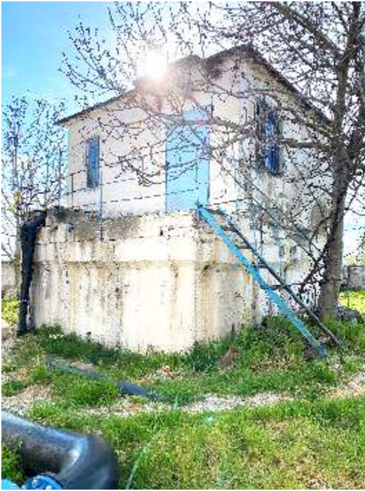
Depo ekzistues nga jashte