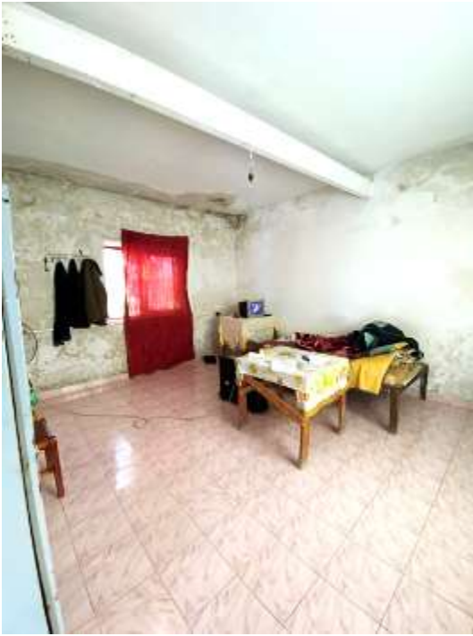
Dhoma e ruajtjes dhe shërbimit