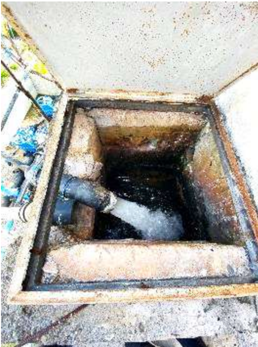
Puseta e kontrollit te depos se ujit dhe tubi I furnizimit nga puset