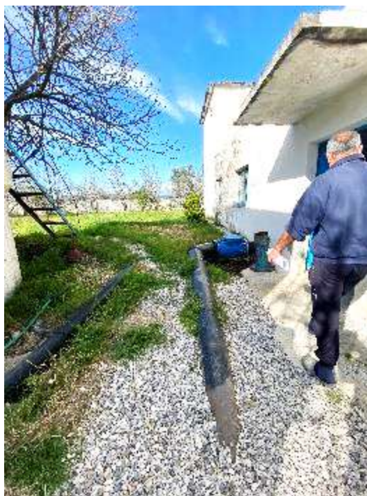
Gjendja nga jashte e tubacionit te dergimit