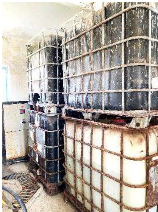
Depozitat e klorit të lengshëm të cilat nuk janë efektive