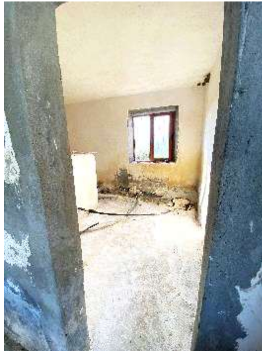
Dhoma e klorifikimit te depos