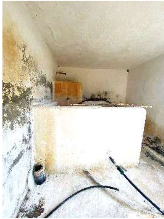
Vaska e klorinimit