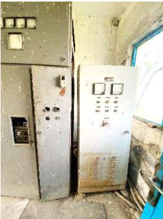
Paneli i kontrollit i amortizuar