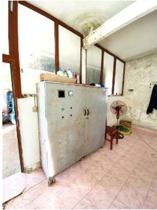
Paneli I kontrollit