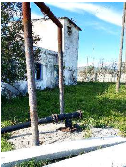
Pusi i marrjes se ujit ne Gajde

Gjendja ekzistuese e furnizimit me uje te fshatrave te njesise Gajde eshte e amortizuar dhe e ndertuar para shume vitesh, rreth 20 -25 viteve me pare. Ne pjesen me te madhe te fshatrave furnizimi me uje behet me puse te shpuara ne menyre lokale per disa shtepi ose ne menyre private nga vete banoret e zoenes per cdo shtepi. Sistemi i vjeter i furnizimit te ketyre fshatrave funksionon nepermjet disa puseve qe ndodhen ne fshatin Gajde si dhe depos grumbulluese ekzistuese qe ndodhet prane ketij fshati me kapacitet 70-100m 3 e cila eshte shume e amortizuar, shiko foto me poshte Nisur nga gjendja ekzistuese e tyre si dhe viti i realizimit te depos dhe te sistemit te dergimit nga depo Gajde ne drejtim te fshatrave eshte shume e vjeter dhe jashte kushteve higjeno sanitare jashte normave. Fshatrat e njesive Allkaj, Krutje, Bubullimë dhe Fiershegan nuk furnizohen me shume se 6 ore nga linja ekzistuese pasi eshte shume larg, e nendimensionuar dhe tejet e amartizuar. Disa foto te gjendjes ekzistuese te depos ekzistuese dhe te stacionit te pompave ekzistues i cili dergon ujin ne depot e lokalizuara ne keto fshatra. Me poshte jepet gjendja ekzistuese e tyre.