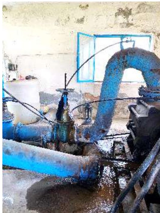
Rrjedhja dhe amortizimi i pompes