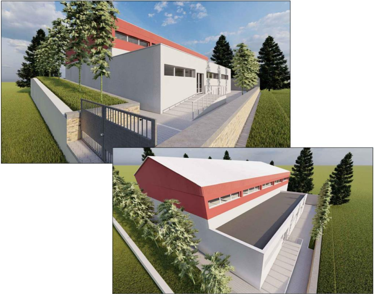
Fig.4. Pamje te objektit

Ne pjesen e jshtme jane zevendesuar panelet sanduic perimetral, eshte bere rilyerja e mureve. Gjithashtu eshte realizuar nje mur rrethues guri per palestren.