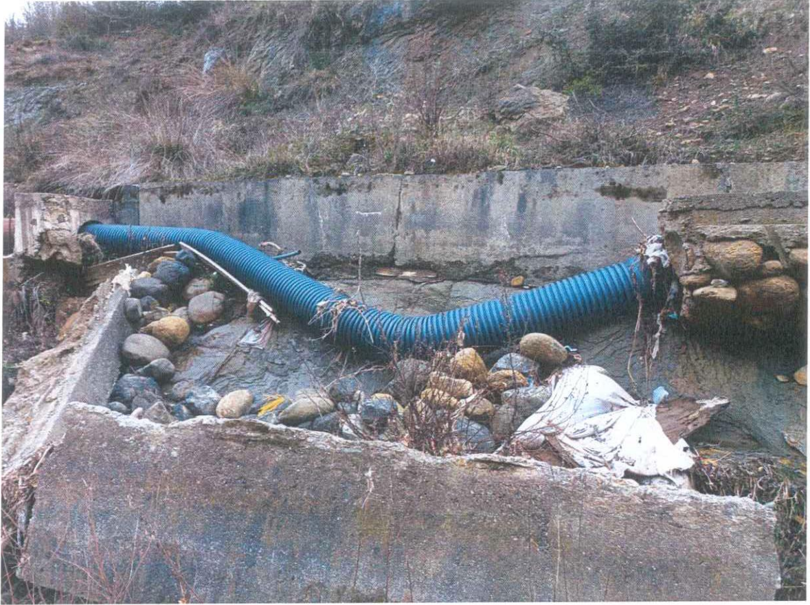
PAMJE EKZISTUESE TUB HDPE I BRINJZUAR I DEMTUAR KOMPLET