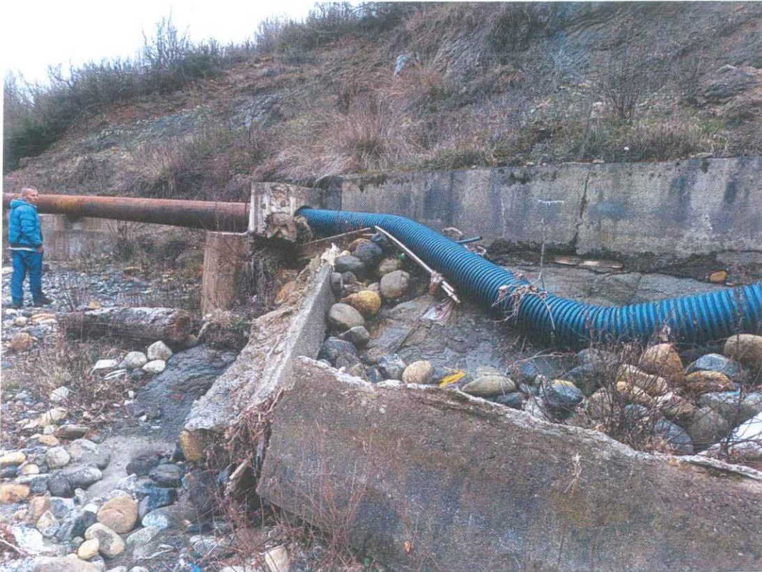
PAMJE EKZISTUESE KANALI MUZHAKE