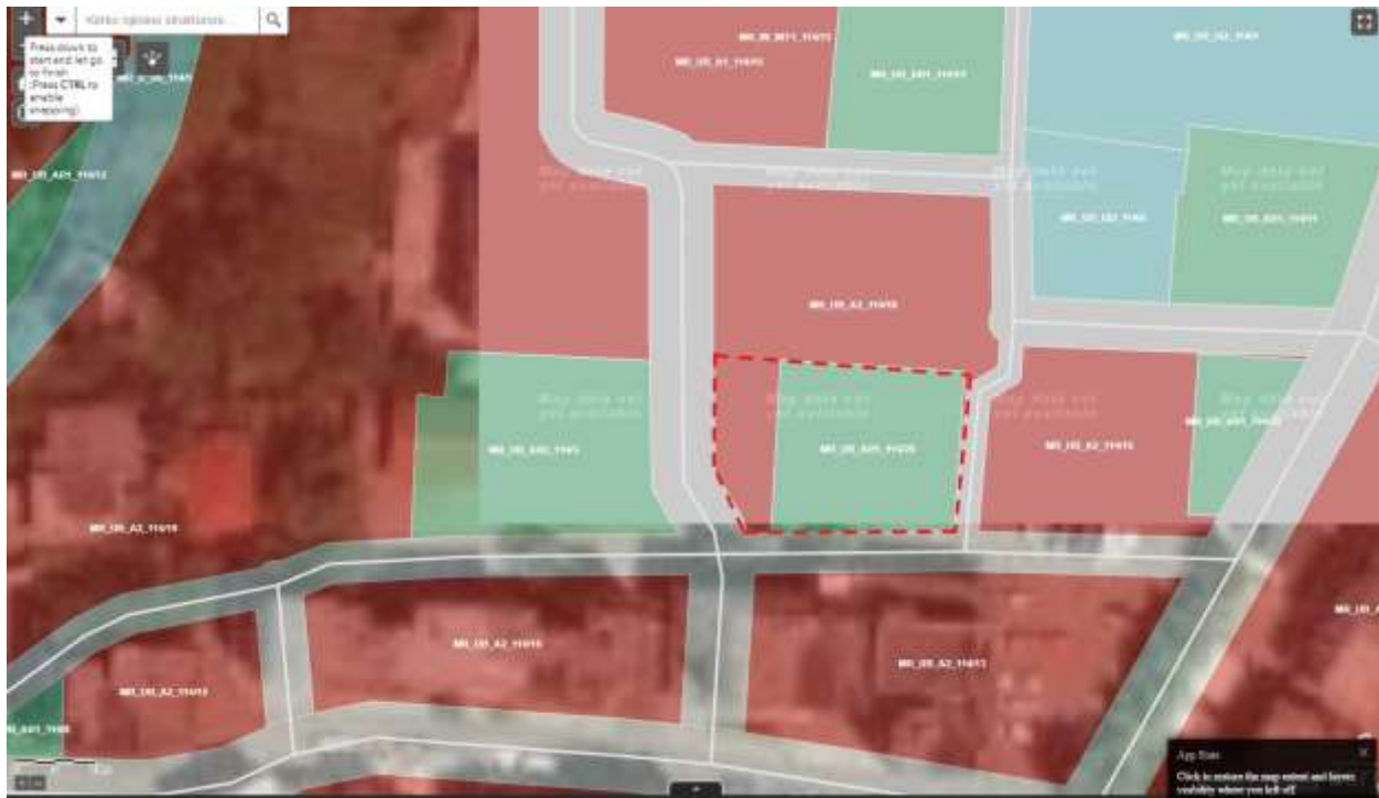
Fig.1 Fragment nga harta e PPV