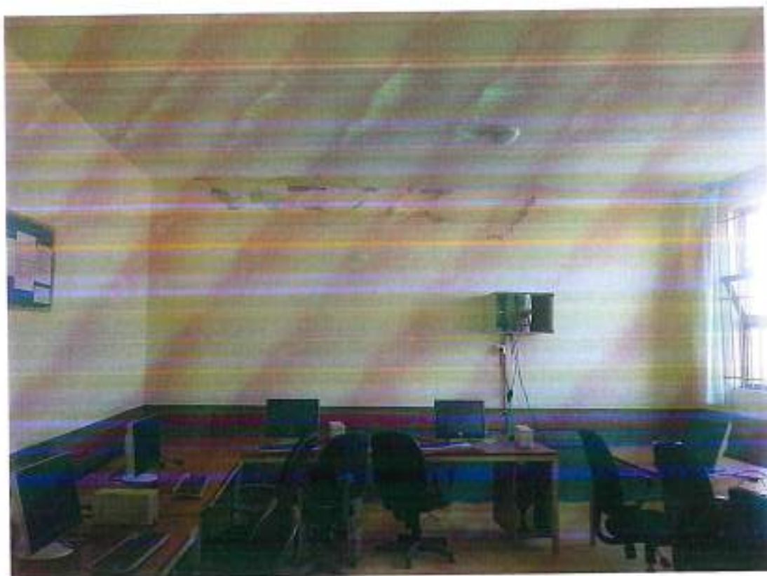
Figura 3. Pamje e sallës kompjuterike.