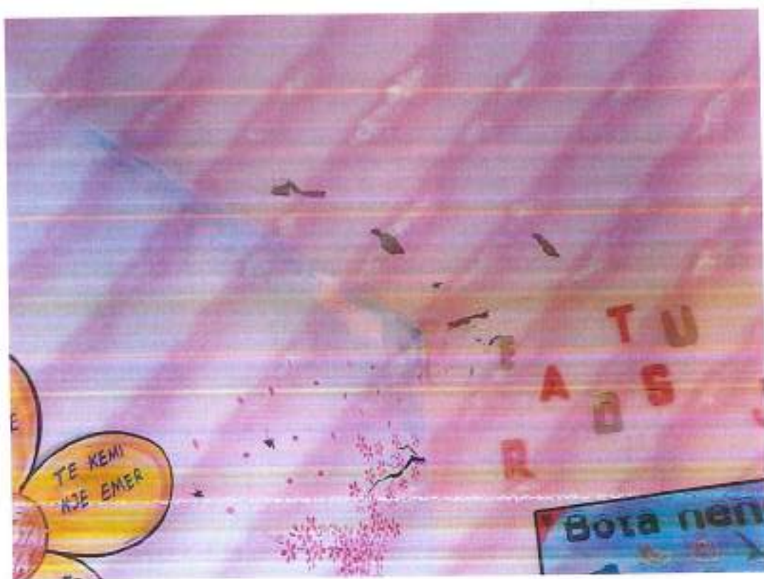
Figura 4. Pamje e klasës së kopshtit