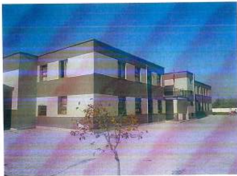
Figura 1. Pamje e jashtme e shkollës 9-vjeçare, Marinëz. ë to vërejmë vetëm gjurmët e mbetura në tavane, ndërkohë që gjatë reshjeve në disa ambiente kemi edhe rrjedhje të vazhduara.

Fotot e mëposhtme dokumentojnë problematikën e ngritur.