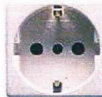
Fig. 2 Kontaktet e tokës

Gjithë prizat, derisa të bëhet një tjetër specifikim, duhet të jenë të tipit 16 amper 2-pin dhe të dala në sipërfaqe. Ato duhet të kenë montim rafsh duhet të kenë një ngjyrë që të shkojë më paftat e çelësve të ndriçimit.